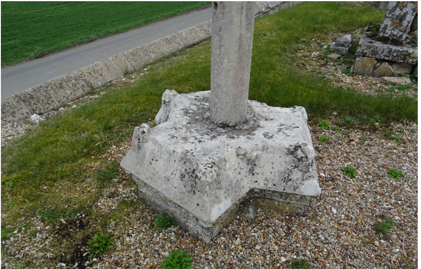
Photographie du monument historique Hôpital